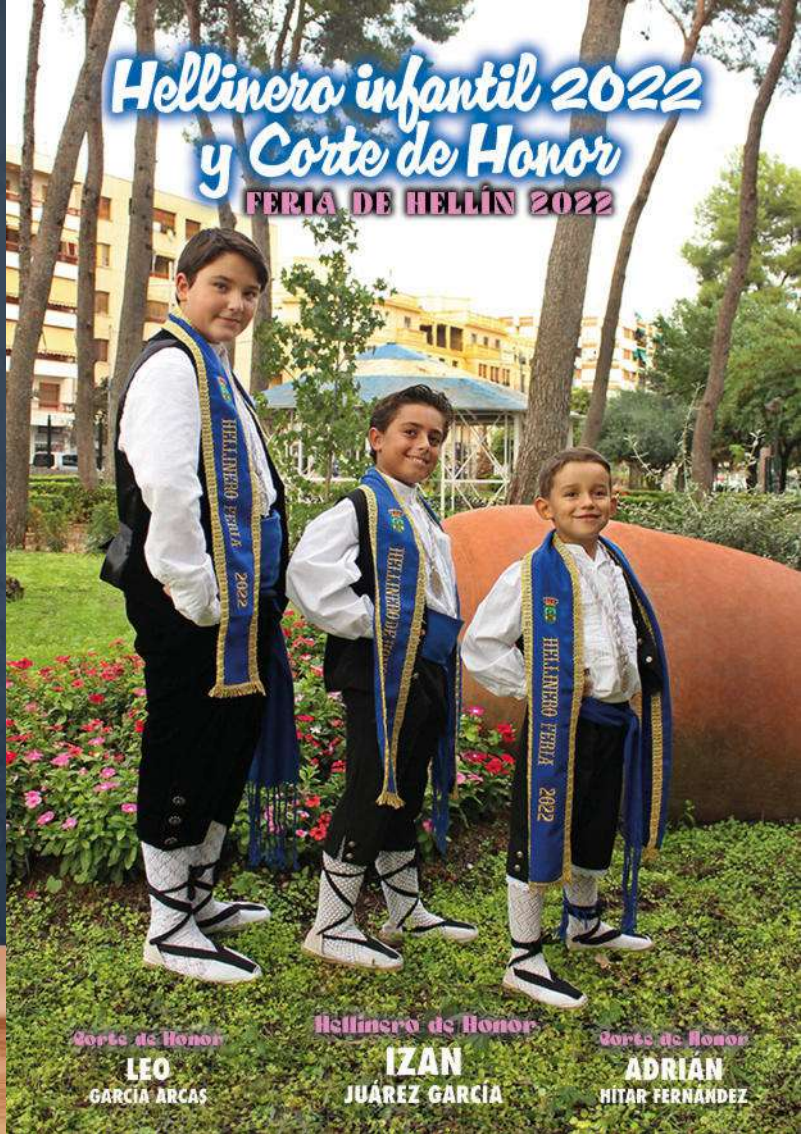
Corte de Honor LEO GARCÍA ARCAS