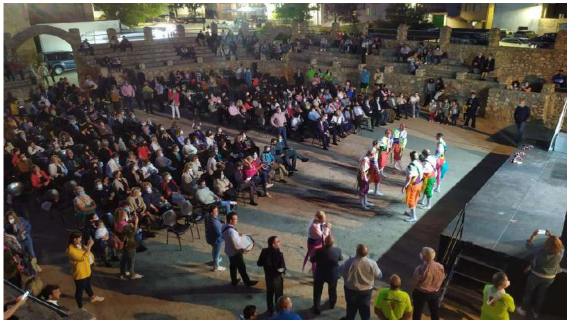
Imagen acto pregón 2021