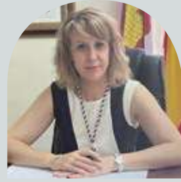
Raquel Jurado Alcaldesa de Almadén