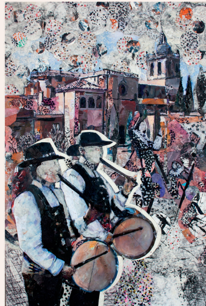
Colage de Andrés Alén